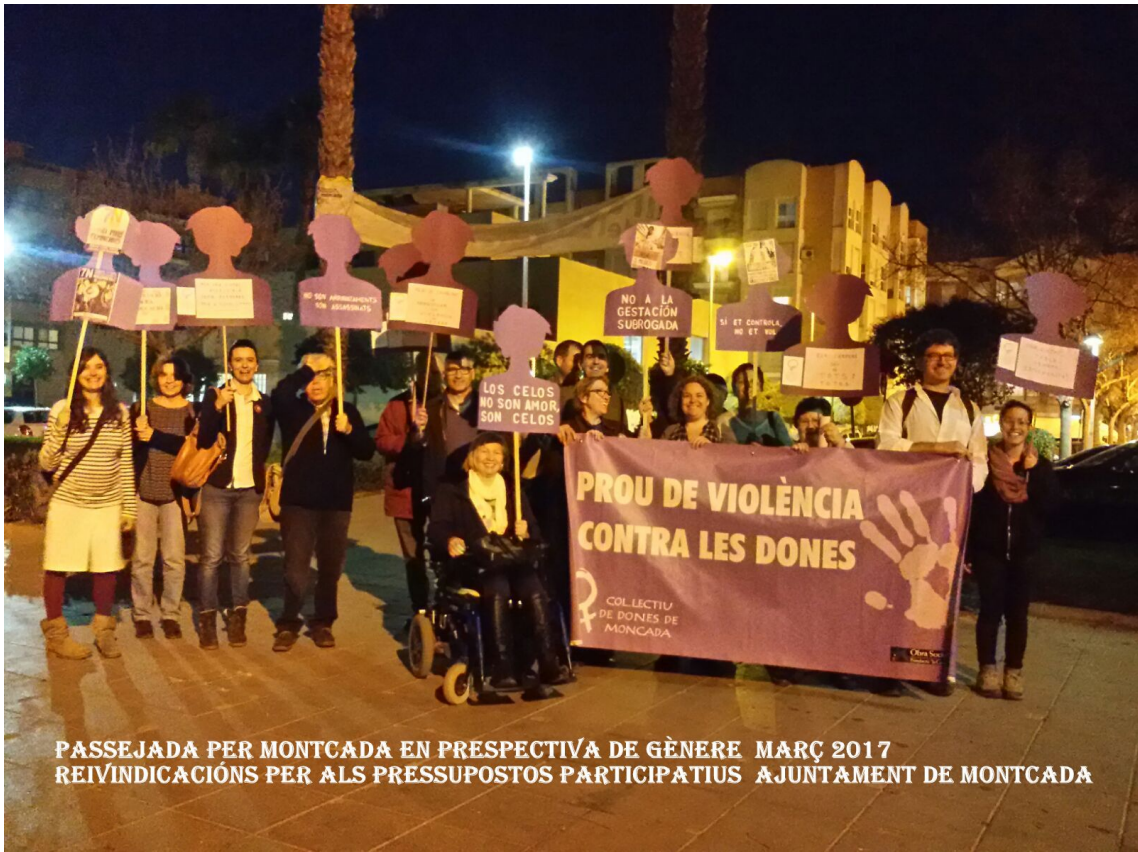
PASSEJADA PER MONCADA EN PRESPECTIVA DE GÈNERE MARÇ 2017 REIVINDICACIONS PER ALS PRESSUPOSTOS PARTICIPATIUS AJUNTAMENT DE MONCADA