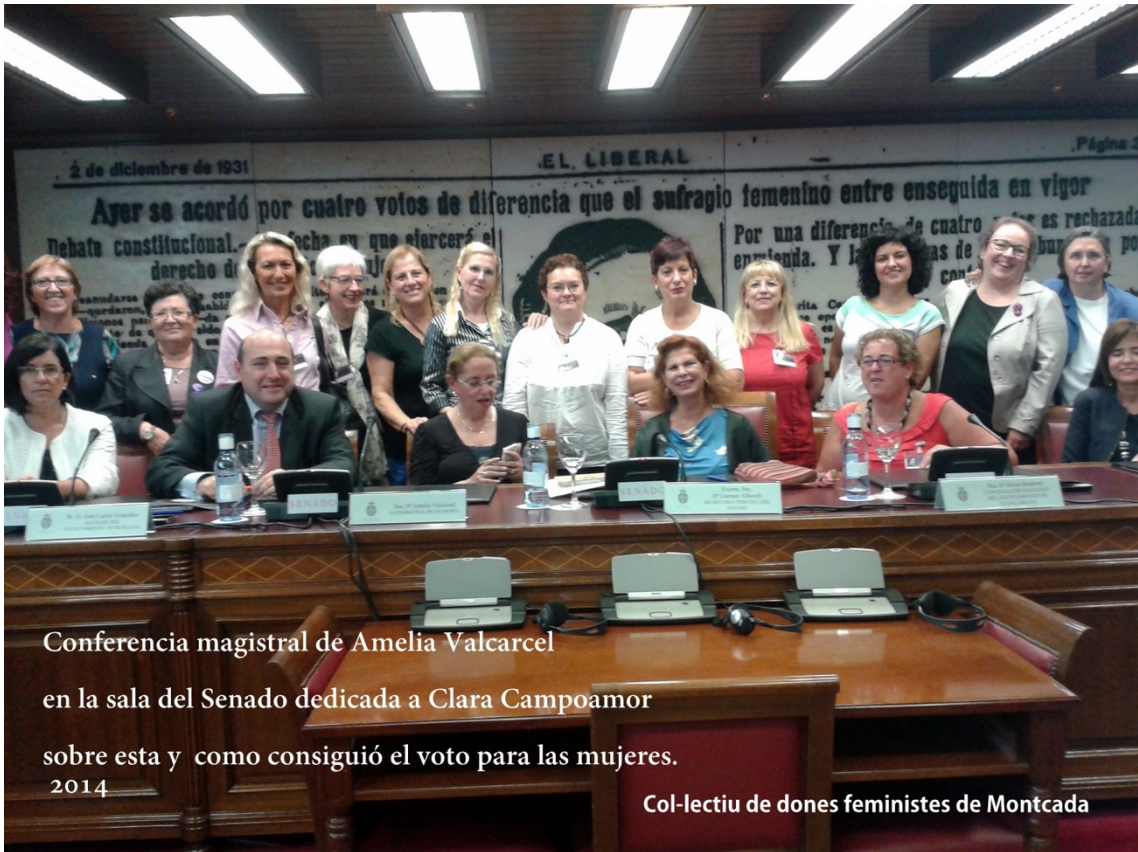
Conferencia magistral de Amelia Valcarcel en la sala del Senado dedicada a Clara Campoamor sobre esta y como consiguió el voto para las mujeres. 2014

Col·lectiu de dones feministes de Montcada