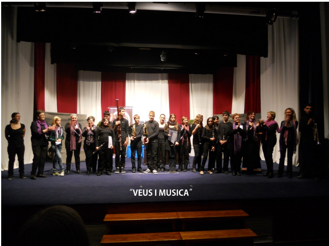
"VEUS I MUSICA"