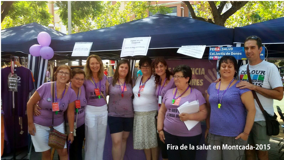
Fira de la salut en Montcada-2015