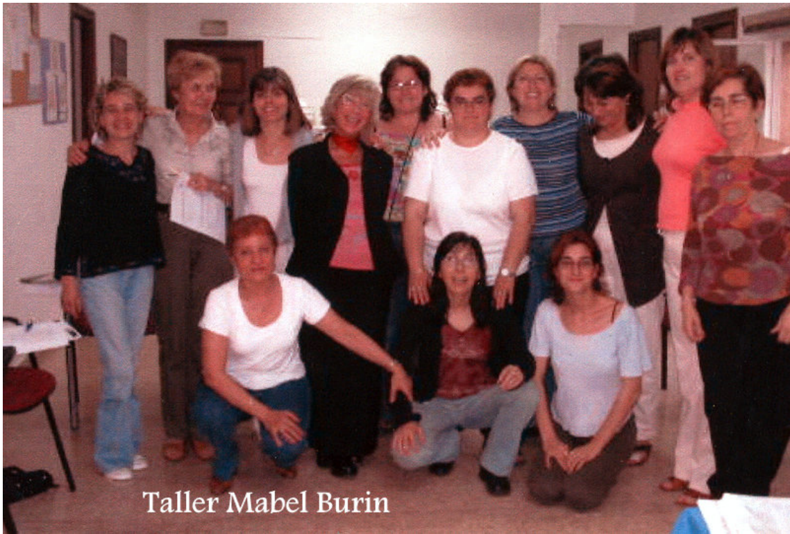
Taller Mabel Burin