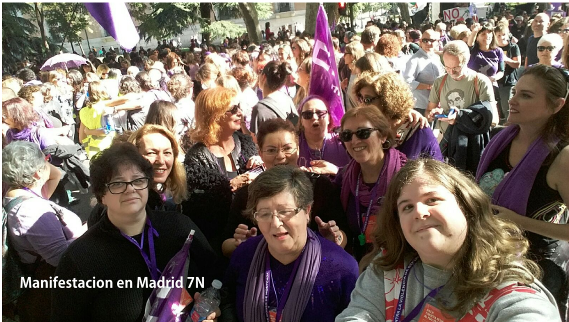
Manifestacion en Madrid 7N

Col·lectiu de dones feministes de Montcada