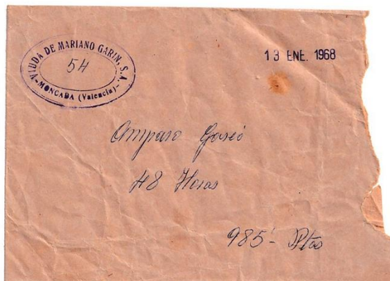
Sobre de cobro d'Amparo Gascó.