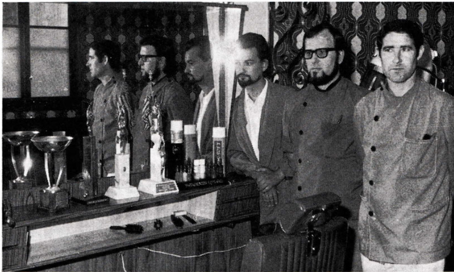
Personal de esta peluquería y trofeos conseguidos por los mismos. Ultimo trofeo en el año actual.

El cliente busca la satisfacción del trabajo eficiente, elegante, perfecto. La moderna peluquería PROMETEO puede darle esa satisfacción que busca y que en nuestra actual sociedad es tantas veces necesaria. En PROMETEO, sus peluqueros conocen su trabajo. Son técnicos a la disposición de la más refinada o completa exigencia.